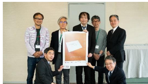
審査会で最優秀賞作品を囲む審査員

高校生以上の学生を対象に公募した「第6回がん征圧ポスターデザインコンテスト」の入賞作品（最優秀賞1点、優秀賞3点、入選8点）が決定しました。このコンテストは、若い世代に「がん」や「がん検診」について知ってもらい、新鮮な発想でがん検診の受診を呼びかけるポスターを作成することを目的に開催しました。